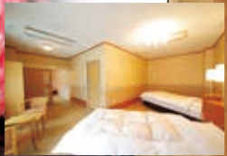
パリアアツリ洋室